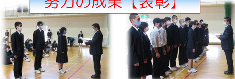
英語・ワープロ・情報処理・漢字の検定等